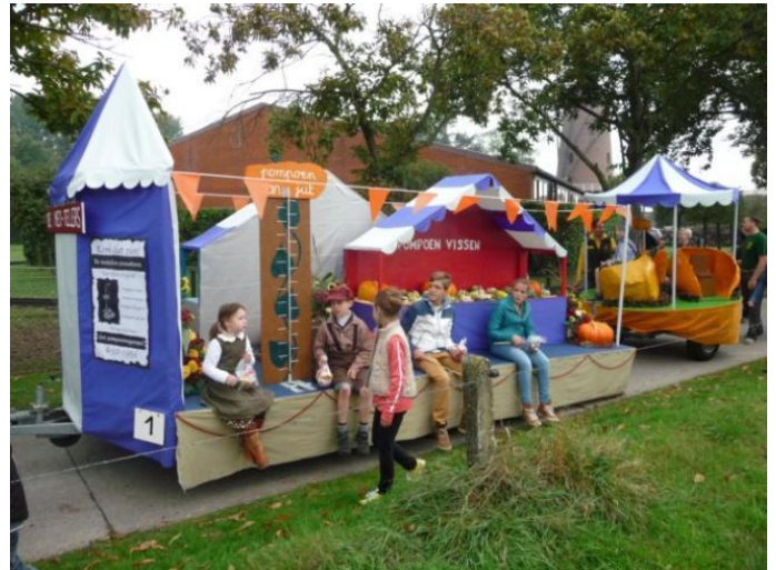
winnende praalwagen van 2013

Met de wedstrijd "Pompoen gewicht schatten" kan het publiek mooie prijzen winnen. En tot slot zal er weer volop geproefd kunnen worden van het exclusieve Pompoenbier, Pompoenjenever, Pompoenlikeur en onze lekkere Pompoenpralines. Kortom deze 15de editie van de Pompoenfeesten belooft terug een heus volksfeest te worden.